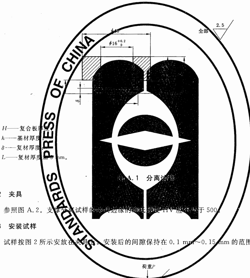
图 A.1 分离试样